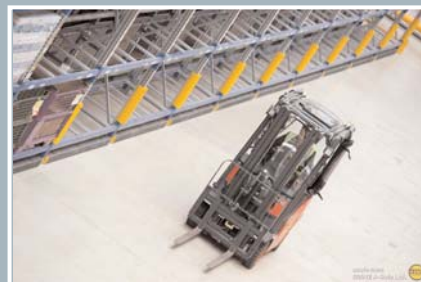
Εφαρμογές των προστατευτικών κρούσης της βρετανικής εταιρείας A-Safe σε βιομηχανικούς και αποθηκευτικούς χώρους, για την προστασία εργαζομένων, οχημάτων και υποδομών.